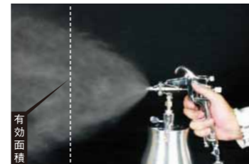
CREAMY(KL)63-W ■テーパードエッジ(フェザーエッジ)Wシリーズスプレーガン Tapered Edge(Feather Edge)W-series type spray gun.