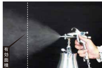
CREAMY(KL)63 ■ストレートエッジ(プラントエッジ)標準スプレーガン Straight Edge(Plant Edge)Standard type spray gun.

※ 上記のスプレーガンのカップは別料金です。 セットではありません。 The selling price of above guns & cups are not the set price. It's separated.