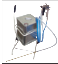
SWS-63KIT-F 〈ガン & キャリーフルセット〉