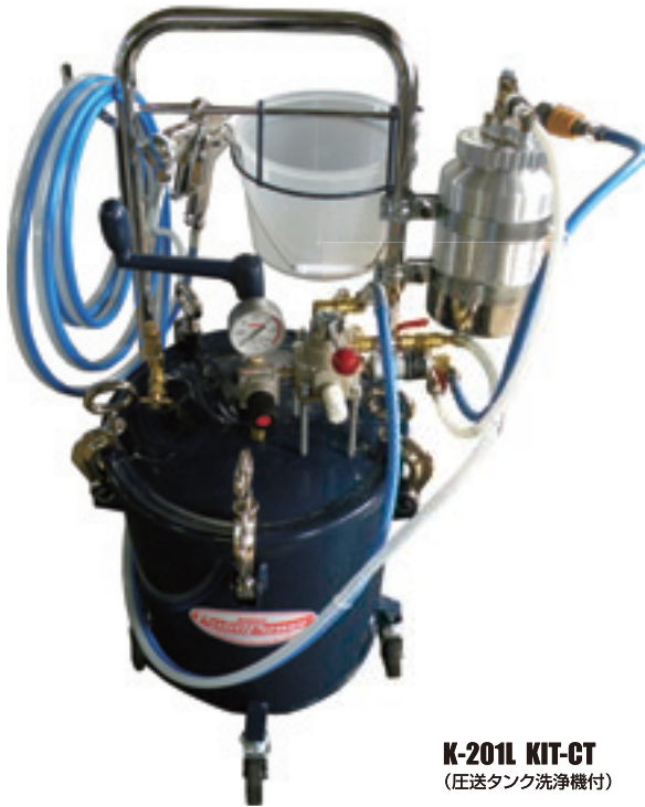
K-201L KIT-CT (圧送タンク洗浄機付)