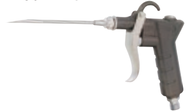
グリップダスターガン K-601B-1G