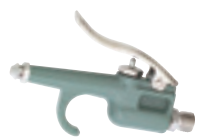
ミニエアードスターガン K-2