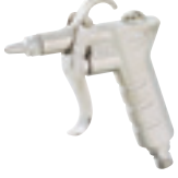
スタンダードタイプダスターガン K-601-0