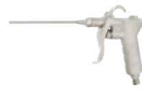
細ノズルエアードスターガン K-601-1S・3S・5S