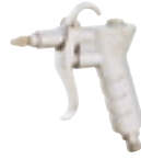
スタンダードタイプダスターガン K-601R-0 (空気調節付き)