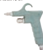
エアードスターガン K-60R (空気調節付き)