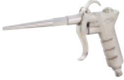
スタンダードタイプダスターガン K-601-1