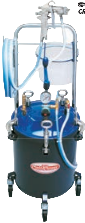
標準スプレーガン CREAMY HPSV