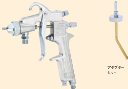
アダプター セット